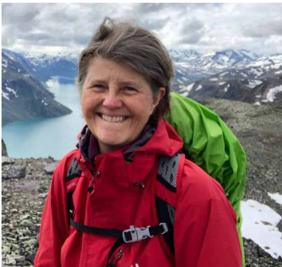
Helle elsker naturen.

kampen. Derfor glæder jeg mig til sammen med alle de mange gode kræfter i vores dejlige parti at sætte kursen mod at få maksimal politisk indflydelse til Socialdemokratiet efter kommunalvalget 2021. Tusind tak for tilliden!