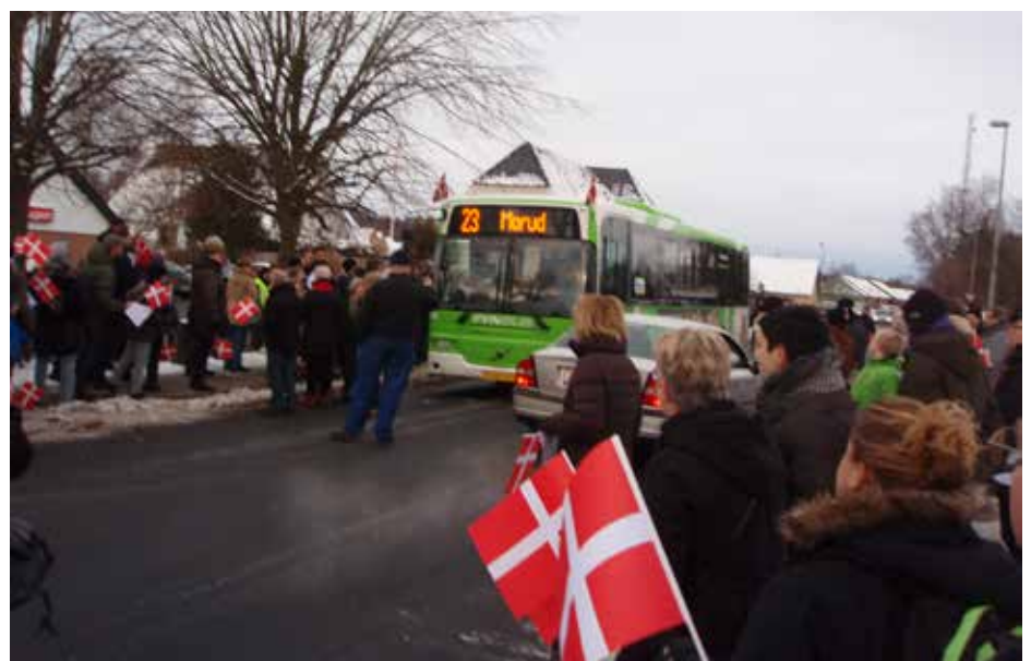
Det blev fejret den 20. januar 2013, da Fynbus for første gang kørte helt til Morud.

Morud er Nordfyns kommunes fjerde hovedby. Vores plads i den allerede udmeldte ringrute (Bynet 21) er historisk. Den knytter Morud endnu tættere til Odense trafikalt, og den er også mentalt vigtig for Moruds brand som bosætningsby. Således nævnes bussen aktivt af alle ejendomsmæglere, der sælger huse i byen, og den benyttes også som bosætningsargument i kommunens markedsføring. I fremtiden skal vi tænke i grøn og fleksibel mobilitet, hvor hyppige busafgange og gode cykelstier m.m. tilsammen kan medvirke til at øge valgfriheden og give klimavenlige trafikløsninger. Her ser vi i Morud Lokalråd gerne, at der i det kommende udbud på ruten lægges op til busmateriel, hvor medtagning af cykler opprioriteres. Hermed vil synergiene ift. den kommende cykelsti Morud-Bredbjerg kunne udnyttes endnu mere i fremtiden.