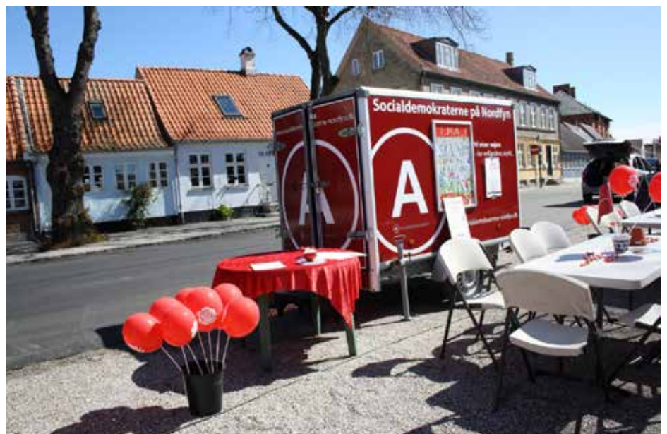
Vi ser frem til, når coronaen er overstået, hvor vi kan komme ud ved markeder og 1. maj-arrangementer og vise de socialdemokratiske flag.

I Region Syddanmark har vi dygtige forskere, prioriterer bedre hospitaler og udnytter teknologiens muligheder. Det er vigtigt. Vi skal værne om lægefagligheden på vores hospitaler, men samtidigt bringe sundheden tæt på ude i de små lokalsamfund. Supersygehuse, ambulancedækning og akut hjælp til psykisk syge og mentalt sårbare er lige vigtigt. Vi skal se region og kommune som et fællesskab – og sikre en strømlinet overgang imellem dem. Komplekse opgaver kræver, at vi forebygger silotænkning, viser hinanden tillid og dermed sikrer en god udslusning fra hospitalerne ved at samarbejde med sundhedshuse og hjemmepleje. Kun på denne måde kan borgeren være i centrum.