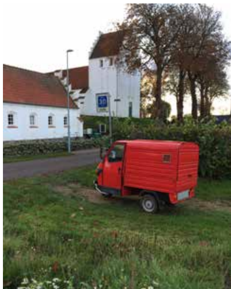
Kirkebilen holder sig klar